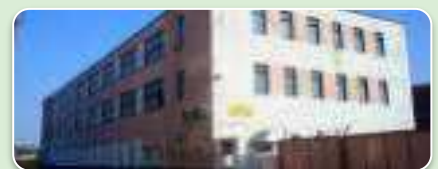
Полацкае рэспубліканскае ўнітарнае паліграфічнае прадпрыемства “СПАДЧЫНА Ф.СКАРЫНЫ” Вул. Ю.Гагарына, 8