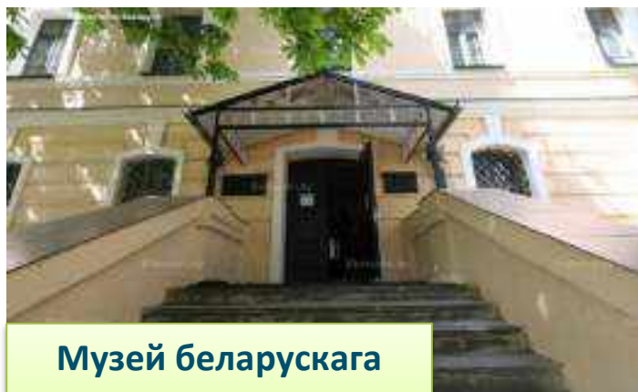
Музей беларускага кнігадрукавання

“Евангелле вучыцельнае” 1595г., “12 прамоў” Іераніма Фалецкага 1558г. Самая тоўстая кніга “Вока Царкоўнае” 1641г. мае 1185 аркушаў. Самая вялікая па памеры – “Каранацыйны зборнік Аляксандра II” У вышыню дасягае метр, яе вага - 26 кілаграмаў. Ёсць калекцыя кніжак-мініяцюр памерам не больш за карабок запалак. Тут захоўваецца самая поўная і вялікая калекцыя кніг-лаўрэатаў Нацыянальнага конкурсу “Мастацтва кнігі”, які праводзіцца з 1960г. Штогод праводзіцца выстава выданняў-лаўрэатаў рэспубліканскага конкурсу “Лепшыя кнігі Беларусі”.