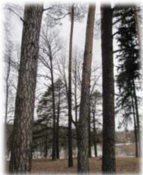
Паўднёвая частка парка