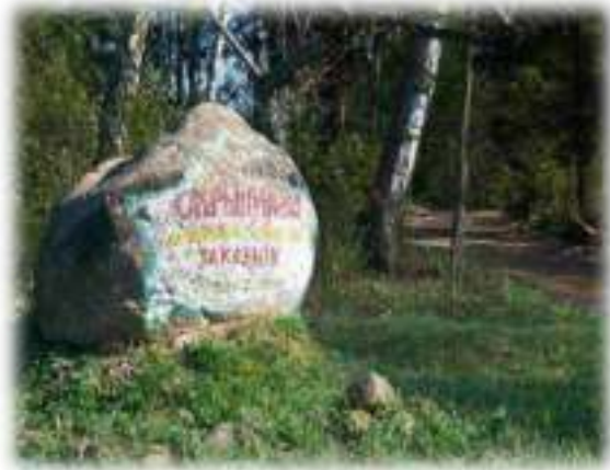
Уваход у заказнік