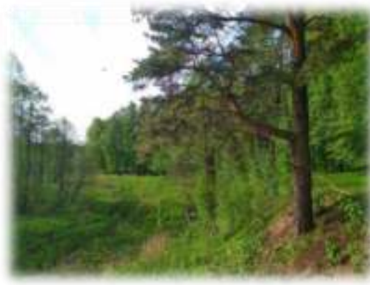
Паўночна-ўсходняя часта парка