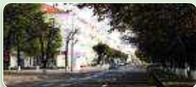
Праспект імя Ф.Скарыны