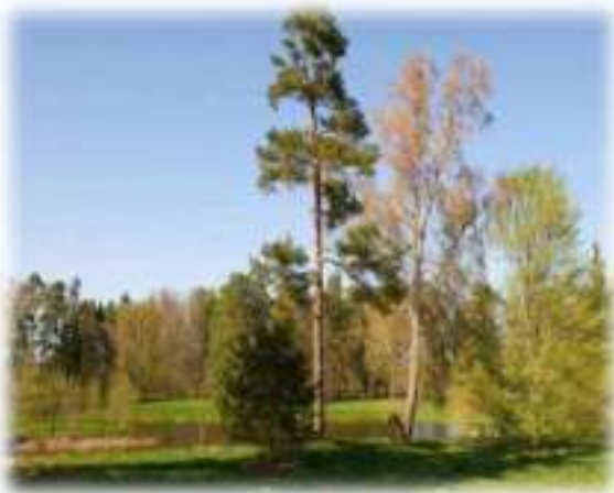
Экзатычныя дрэвы парка