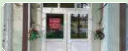
ГУК “ПОЛАЦКАЯ РАЁННАЯ ЦЭНТРАЛЬНАЯ БІБЛІЯТЭКА ІМЯ Ф.СКАРЫНЫ” Вул. Гоголя, 15