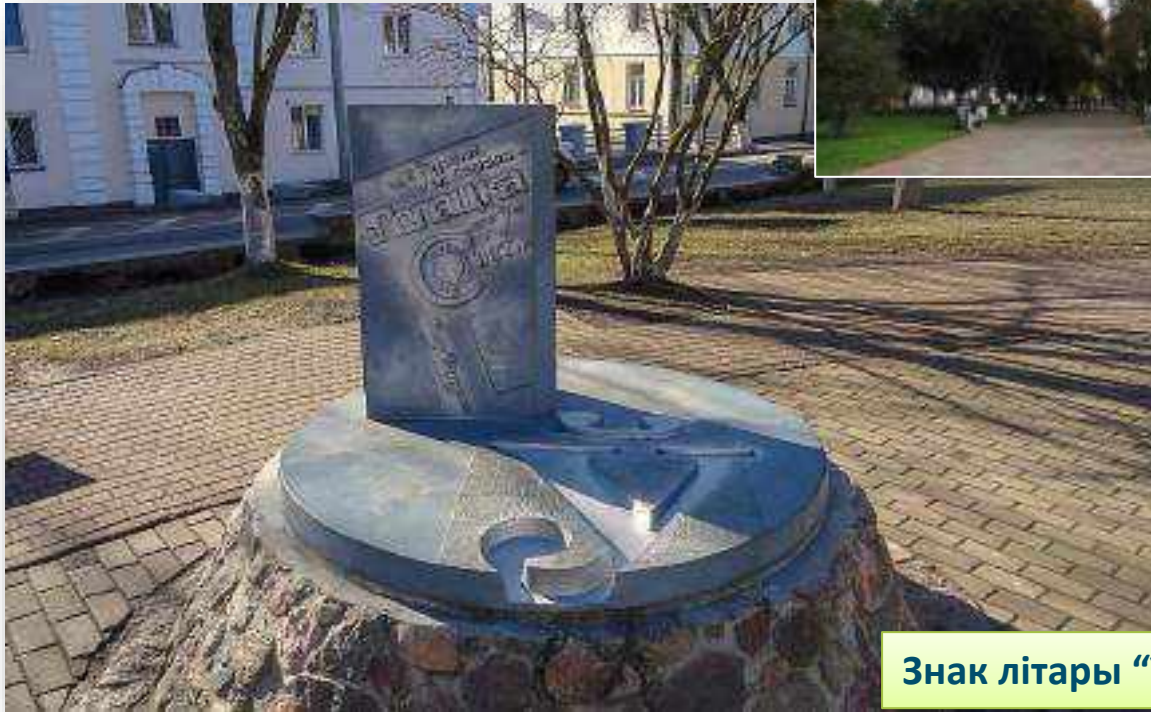
Знак літары “Ў”