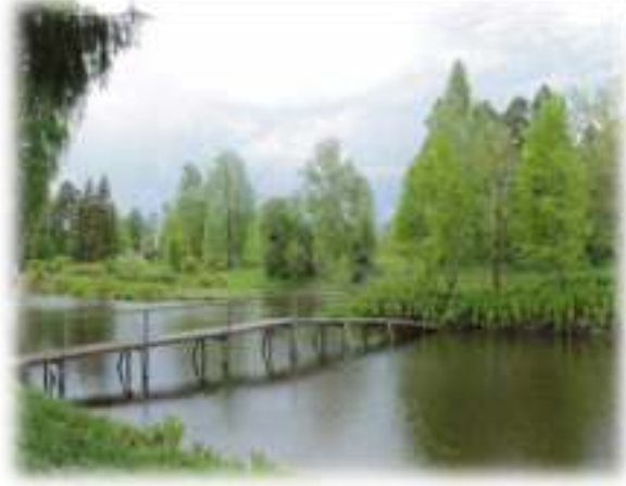
Частка возера з астраўкамі