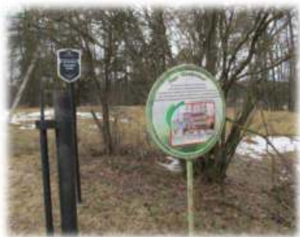
Уваход у парк