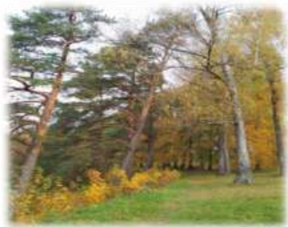
Магутныя дрэвы парка