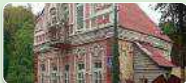
вуліца імя Ф.Скарыны