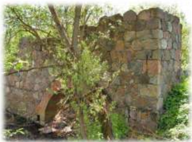
Рэшткі вадзянога млына каля Волатавага хутара