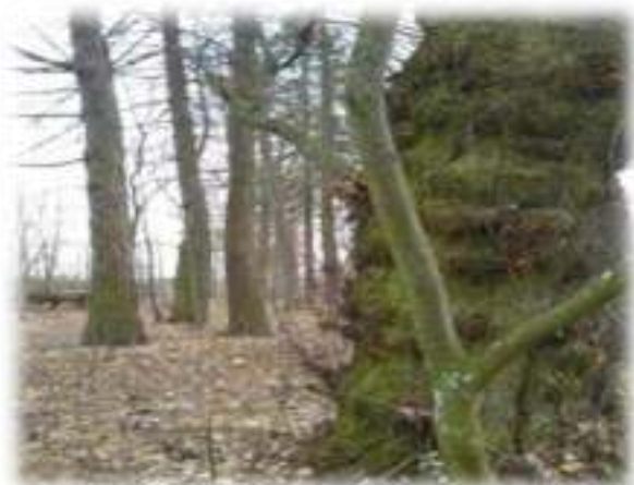
Магутныя дрэвы парка