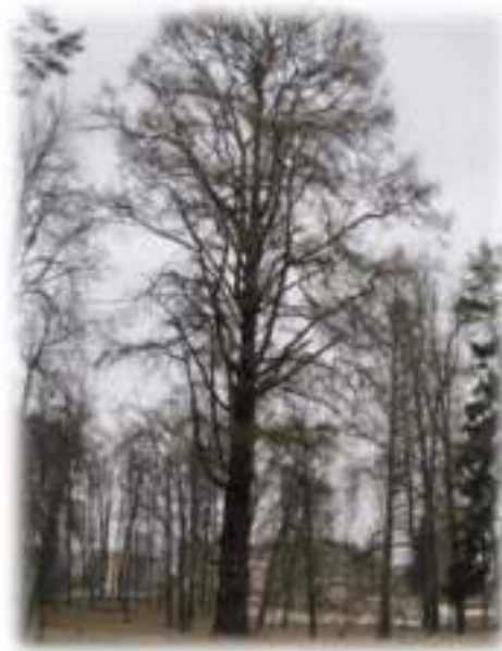
Паўднёвая частка парка