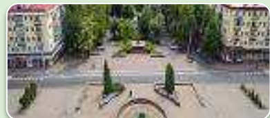
плошча імя Ф.Скарыны