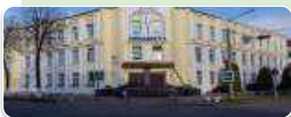
УА “ПОЛАЦКАЯ ДЗЯРЖАЎНАЯ ГІМНАЗІЯ №1 ІМЯ Ф.СКАРЫНЫ” Вул.