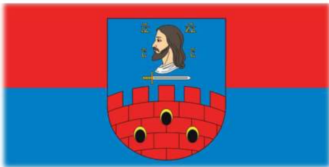
Флаг і герб Віцебскага раёна.