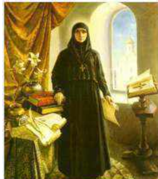
Прападобная Еўфрасіння Полацкая

Князеўна Прадслава – прападобная Еўфрасіння Полацкая ((каля 1101-1005)-1167), унучка славутага полацкага князя Усяслава Чарадзея. Без гэтага імя немагчыма ўявіць не толькі духоўнае жыццё на ўсходнеславянскіх землях у XI стагоддзі, але і ўсю шматвекавую гісторыю Беларусі. Яна выбірае не лёс князеўны, а лёс манахіні, асветніцы і кніжніцы, лёс ігуменні Полацкай абіцелі. І на гэтым шляху яна дасягае святасці. Спачатку Еўфрасіння перапісвала і перакладала кнігі ў Сафійскім саборы.. А калі бацька пабудаваў для яе манастыр, перайшла ў яго: з цягам часу там пачалі працаваць майстэрні па перапісванні кніг.